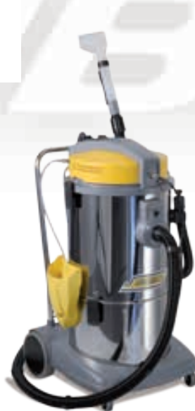
M 21 I Auto

La versión que Auto, ha suministrado la boquilla manual y un tubo de 6 m. (Ø 40) para facilitar la extracción del interior del coche en incluso el más difícil de alcanzar. Los modelos M 21 están equipados con una bomba con una potencia de 48 W, caudal 1,1 l / min, presión de 7 bar. Capacidad del depósito de detergente de 21 litros, llena fácilmente gracias a la gran boca de carga situada en el lado de la máquina. Tanque de recuperación (22 l) fácil de vaciar, es el tubo de escape utilizando que la eliminación de todo el tanque en unos pocos pasos simples. Control independiente de la contaminación accionada la bomba.